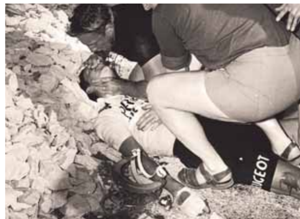
Her forsøker de forgjeves å få liv i Tom Simpson igjen etter kollapsen.

Mytene om Mont Ventoux er mange , og fjellet har krevd sine offer. Ingen syklist er ukjent med historien om Tom Simpson, og tragedien inntraff på den 13. etappen i Tour de France 1967, også denne med målgang i Carpentras. Briten var en av sammenlagtfavorittene etter å ha vunnet Paris-Nice tidligere på sesongen, og var svært populær på grunn av sin offensive kjørestil. Simpson lå på en respektabel 6. plass sammenlagt før etappen, men hadde prestert under evne, mye på grunn av sykdom og mageproblemer. I likhet med Poli's 15. etappe i 1994, var dagen kvelende varm. Simpson slet med å henge på teten, og løsningen ble en giftig cocktail av Cola, konjakk og amfetamintabletter.